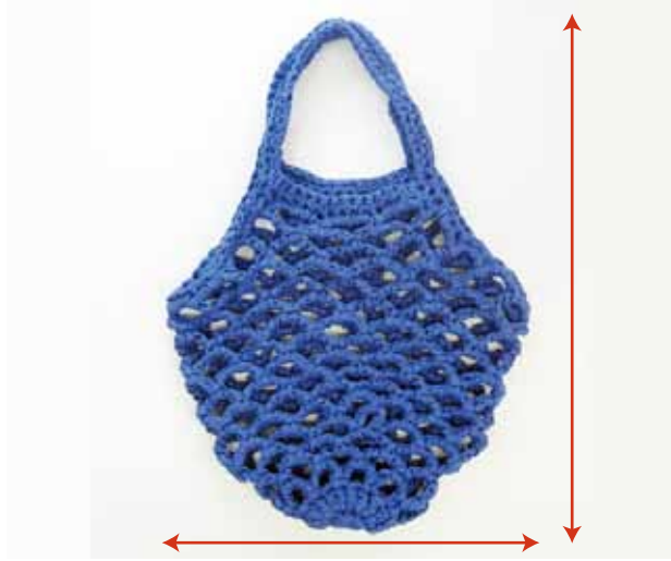
出来上がりサイズ ヨコ約 30cm、タテ約 45cm