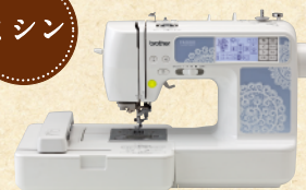
ブラザーミシン Family Marker FM800

★ミシンに関するお問合せは… ブラザー販売株式会社「お客様相談室」 ☎0120-340-233 http://www.brother.co.jp