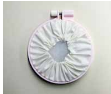
写真はキルト芯を入れています。