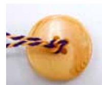
コードを引き締めた状態