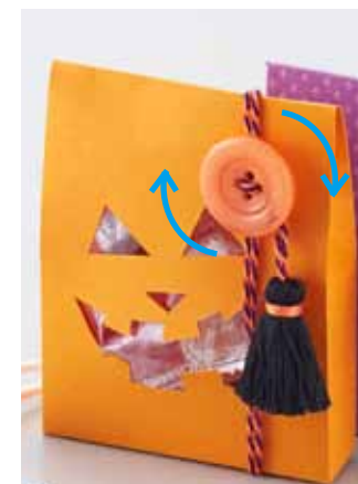
ボタンにコードを巻き付けて固定させることができます。