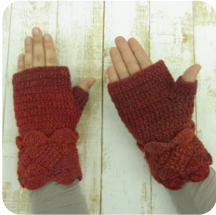
デザイン・制作 大江千比美