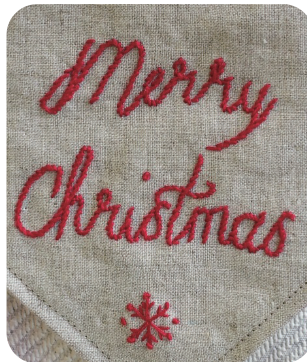
(参考) 作品の刺しゅう部分