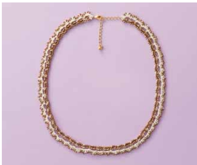
デザイン／アトリエ seeds