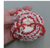
編み地の裏側で糸端同士を結び始末する