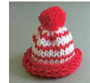
帽子の縁部分の編み地を折り返して形を整える