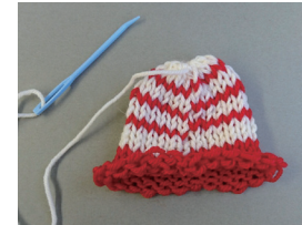
オーバルニットルームから編み地を外し、糸を引き絞る