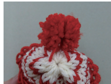
ポンポンの中心を結んだ糸をこのように編み地に通す