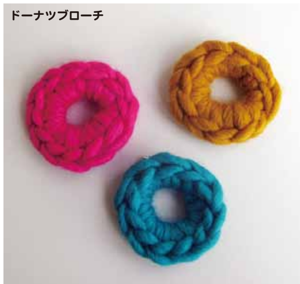
ドーナツブローチ