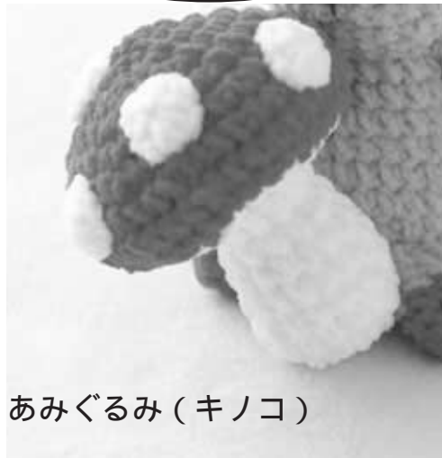
あみぐるみ (キノコ)