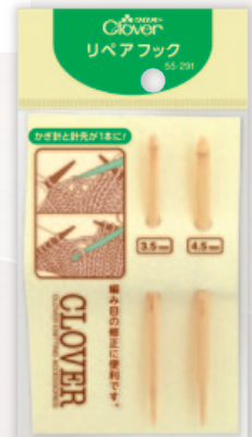
※パッケージはイメージです